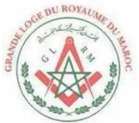
المحفل الكبير للمملكة المغربية